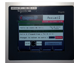
Ecran de supervision et pilotage