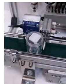
Poste de lecture RFID