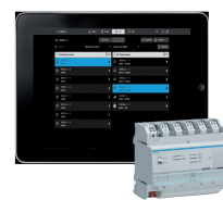
Configurateur Easy (tablette non livrée)