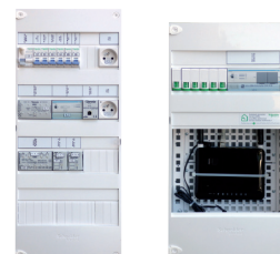
Coffret de distribution - Coffret VDI