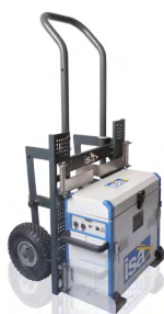
Valise de transport et chariot