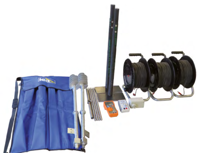
KIT ACCESSOIRES POUR LE TEST DE TERRE