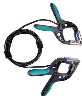
Câble de raccordement avec petites pinces TTA