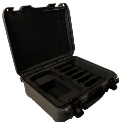
Coffre de transport en plastique pour TWR-H, TRT-H et RMO-TH