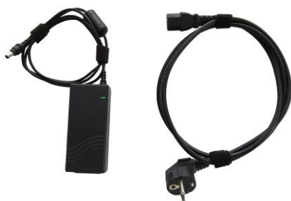
Câble d'alimentation avec adaptateur d'alimentation 18 V / 3 A