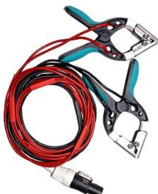
Câbles de courant et détecteurs de tension d'enroulement BT avec petites pinces TTA