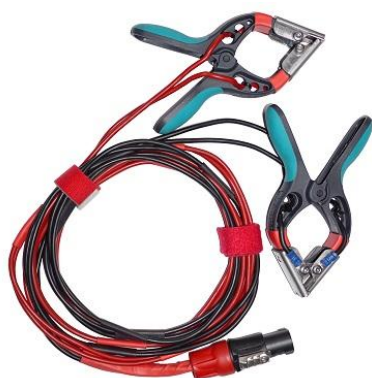
Câbles de courant et détecteurs de tension d'enroulement HT avec petites pinces TTA

Toutes les présentes spécifications sont valables à des températures ambiantes de +25 °C, et avec les accessoires standards. Les spécifications sont sujettes à modification sans préavis.