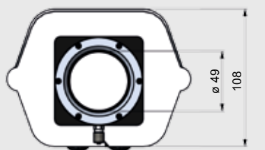
le raccord du tuyau 5 x 3