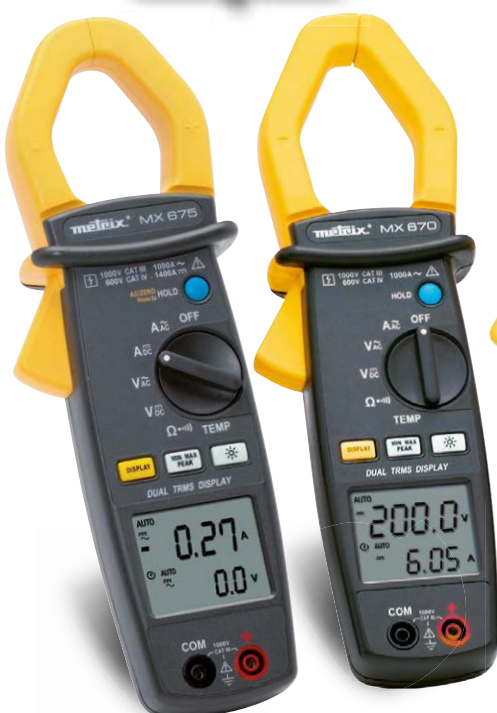
MX 675 & MX 670