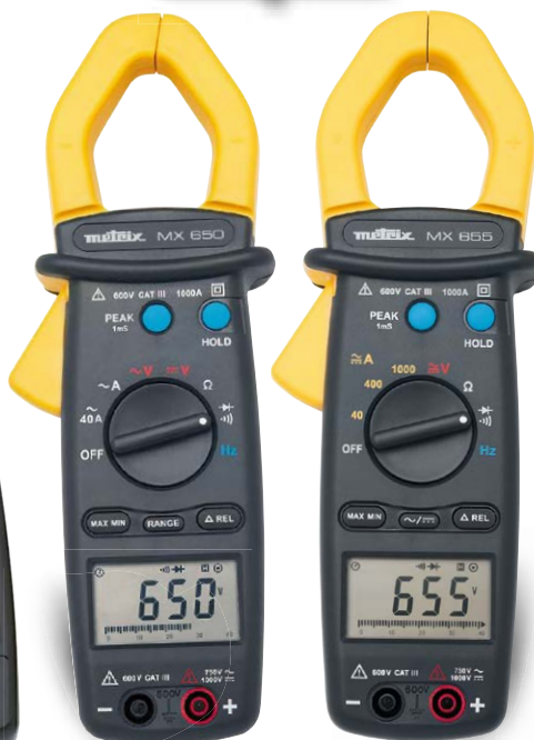
MX 655 & MX 650