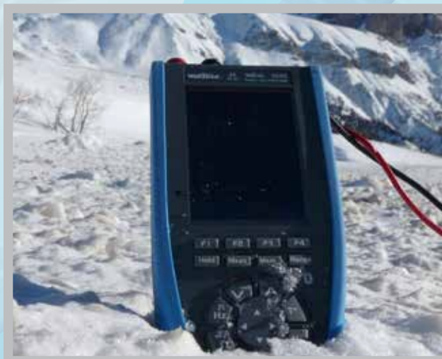
IP67, l'étanchéité des ASYC IV leur permet de couvrir des applications en environnements difficiles