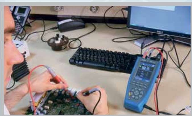
... ou en après-vente