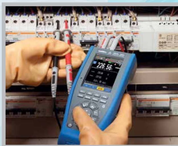
Mesures sur armoires électriques