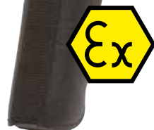
Fluke 568 Ex