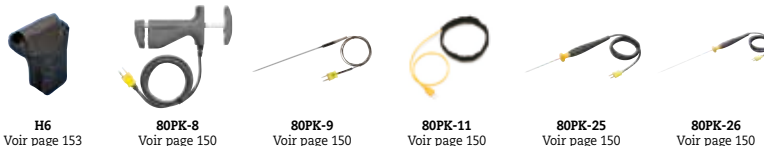
H6 Voir page 153