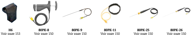
H6 Voir page 153

Fluke 566 Thermomètre infrarouge Fluke 568 Thermomètre infrarouge Fluke 568Ex Thermomètre infrarouge à sécurité intrinsèque (ATEX)