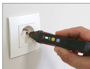
Repérage de phase