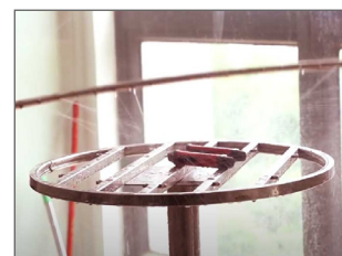
Test d'étanchéité IP67