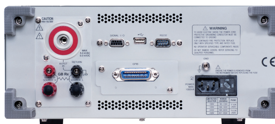
Vue de la face arrière

Demande de renseignements au 03 25 71 25 83 ou par e-mail : infos@distrame.fr - Site Internet : www.distrame.fr