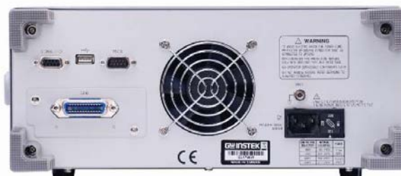
Vue de la face arrière avec option FI 90x5-GPIB