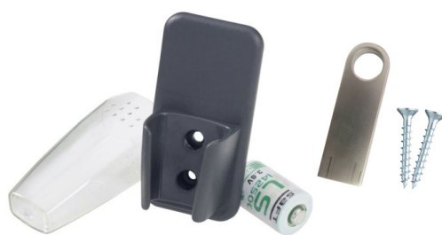
Accessoires livrés en standard