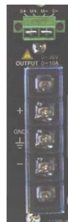
Borniers de sortie en face arrière avec fonction "sense"