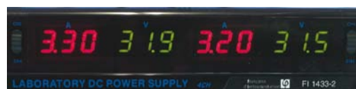
Afficheurs numériques 3 digits (verts pour la tension et rouges pour le courant)