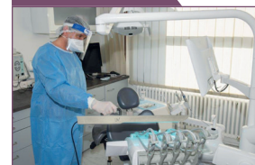
Utilisation de l'appareil