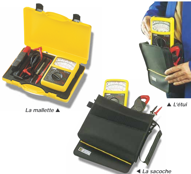
▲ La mallette