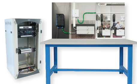
Ensemble banc + baie NRO

NB : Prévoir une journée d'installation sur site et 1 journée de formation dédiée au GPON.