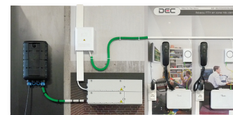
Panneau de mise en situation équipé