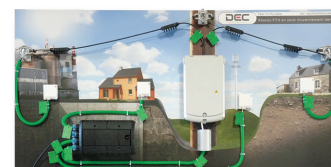
Panneau de mise en situation équipé